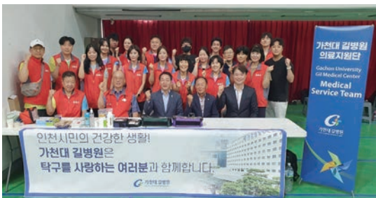
가천대 길병원, 인천시장배 탁구대회 의료지원 봉사단 파견 (8/17~18)

가천대 길병원에서 개발 중인 인공지능 위암 예측 소프트웨어가 최근 식품의약품안전처 의료기기 제조 허가를 획득했다. 가천대 길병원은 과학기술정보통신부, 정보통신산업진흥원이 주관하는 '시정밀의료솔루션(닥터앤서