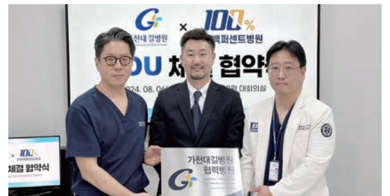
가천대 길병원-연세백퍼센트병원, 진료협력을 위한 협력병원 체결식 (8/7)