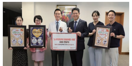
가천대 길병원 임직원 헌혈 봉사 지속, 대한적십자사 인천혈액원 감사 전하와