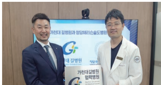
가천대 길병원-청담해리순송도병원, 진료협력을 위한 협력병원 체결식 (8/20)